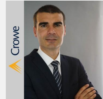
Stefano Barlini Crowe Bompani SpA Via Leone XIII, 14 Milan , 20145